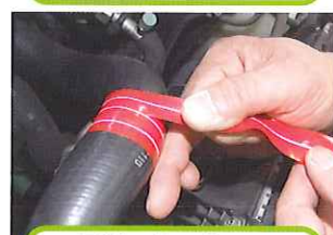
ラジエーターホース