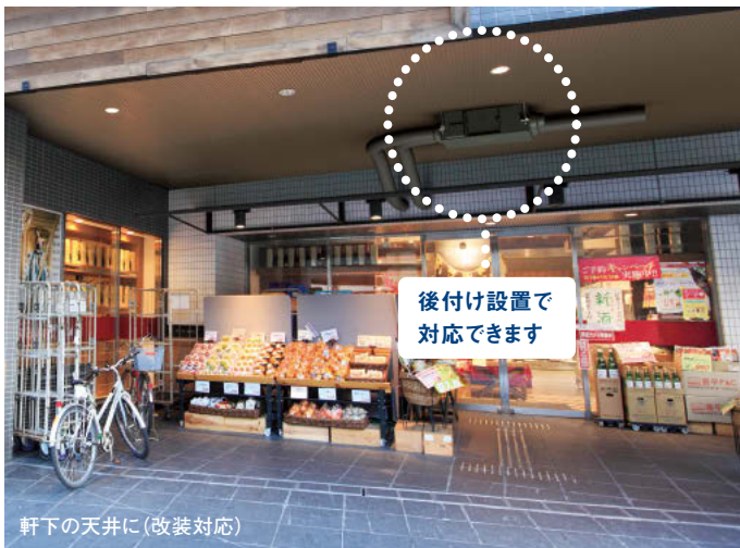
軒下の天井に(改装対応)